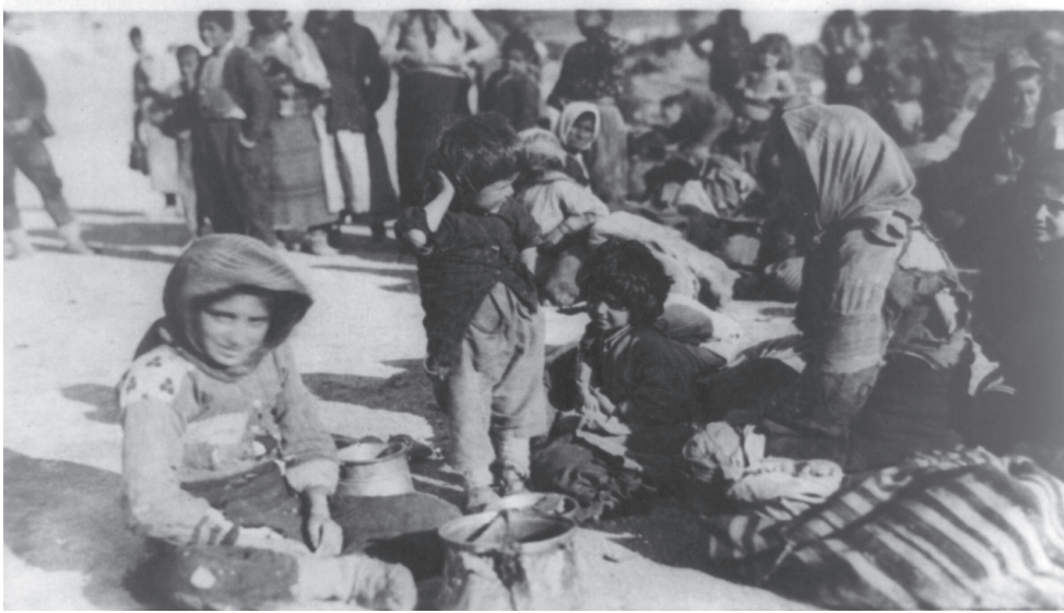
Armenische Flüchtlinge, für Griechenland eingeschifft und in Syrien.

schaft oder Kolonisierung. Das zeigt ein privater Briefwechsel zwischen Wangenheim und Jagow. In einem Schreiben vom 8. Mai 1913 ging Jagow davon aus, »daß auch die asiatische Türkei zusammenbricht«, und für ihn war auch klar, daß Deutschland davon zu profitieren gedachte. Aber: »Unsere Interessen haben noch zu wenig Wurzeln geschlagen u. unsere Interessensphäre ist noch zu wenig durch feste Grenzen bezeichnet.« Immerhin sei »das Gebiet, auf welches uns die Zukunft hinweist, von allem Türkischen Besitz ja das Türkischste.« 47 Am 29. Juli ging Jagow einen Schritt weiter: »Die Türkei hat für uns nur noch das eine Interesse: daß sie in Asien noch solange fortbesteht, bis wir uns in unseren dortigen Arbeitszonen weiter konsolidieren u. für die Annexion fertig werden.« Bis dahin sei Reichspolitik, die Türkei zu erhalten, »so lange unser Interesse es erfordert.« 48 Die Türkei, so Jagow, »ist für mich nur noch der Knochen, den die anderen Hunde nicht fressen sollen, solange ich nicht müßten mag«. Der Ausbruch des Weltkriegs veränderte die Interessenlage, nunmehr bestimmten die Militärs den Gang der Dinge.